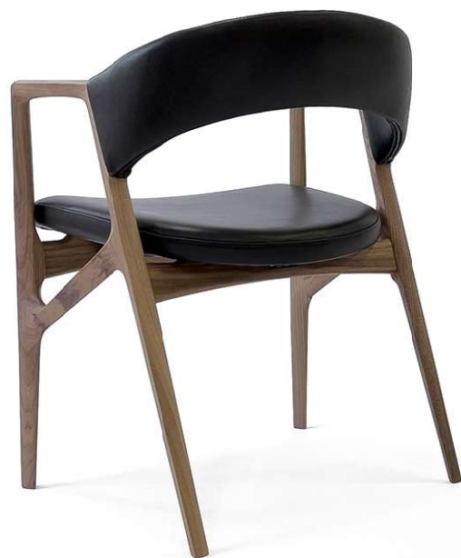
Owl アームチェア design by Kazushi Suzuki

自然界の儚さや力強さを家具に落とし込んだ、正に美しいデザイン。 ディテールまで追求したこだわりが家具に深みを与えます。 共に過ごす日々、洗練された息吹を感じて。