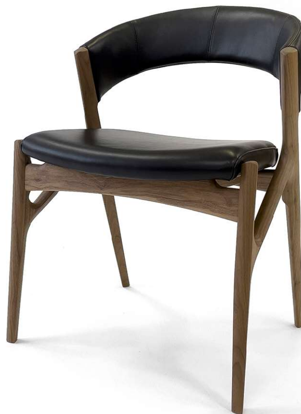
Owl アームレスチェア design by Kazushi Suzuki